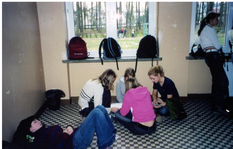
Fotografia 2. GDZIE SĄ ŁAWKI ((TYTUŁ NADANY PRZEZ UCZNIĄ)