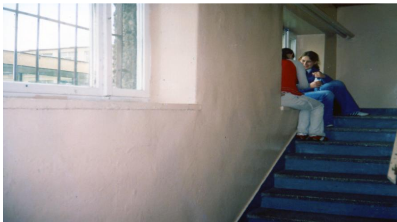
Fotografia 1. ULUBIONE ZAKAMARKI (TYTUŁ NADANY PRZEZ UCZNIĄ)

GO I OCENY JAKOŚCI PRACY SZKOŁY ETAP III Jagiellońskim i Ewą Ewaluacji Sp. z o.o. w ramach