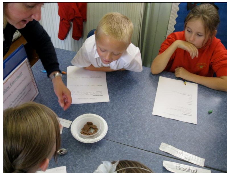
Wizytacja na lekcji przyrody